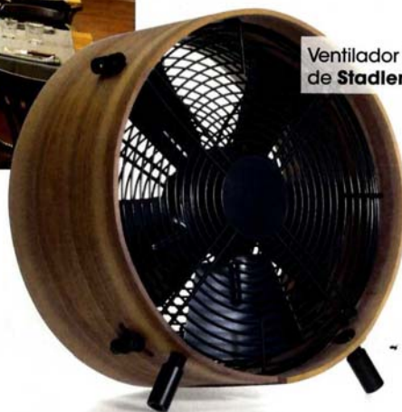
Ventilador (150 €), de Stadler Form.

ESPACIOS AUTÉNTICOS O SIMULADOS QUE APUESTAN POR EL LADRILLO, EL METAL, LAS TUBERÍAS VISTAS... 1. FÁBRICA DE CERVEZA MORITZ. HOY ES UN CENTRO GASTRONÓMICO (RDA. SANT ANTONI, 41; BARCELONA). 2. DO DESIGN. TIENDA DE MODA, MUEBLES, ARTE, CAFETERÍA... (FERNANDO VI, 13; MADRID). 3. RESTAURANTE MUSSOL. RECREA UNA VIEJA MASÍA (AV. DIAGONAL, 488; BARCELONA).