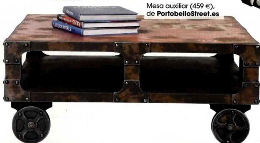
Mesa auxiliar (459 €), de PortobelloStreet.es