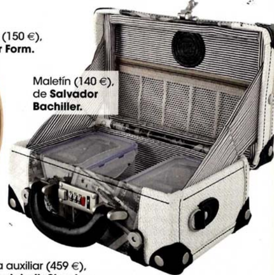
Maletín (140 €), de Salvador Bachiller.